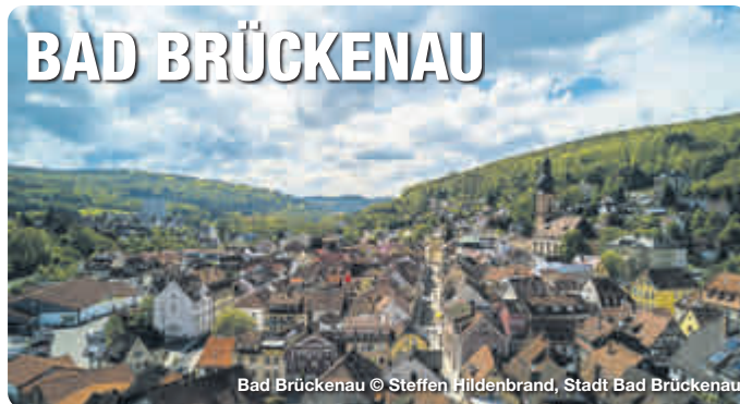
Bad Brückenau

Umgeben von herrlicher Natur, im Tal des Flusses Sinn, liegt die kleine Stadt Bad Brückenau. Hier im Herzen Deutschlands, im Norden Bayerns, hat sich über Jahrhunderte eine ganz besondere Gastfreundschaft entwickelt. Diese liegt in der Tradition des Ortes begründet. Schon seit Jahrhunderten kommen Gäste und Besucher, um hier die heilenden Kräfte der Natur und der sieben Heilquellen zu nutzen. Als Besonderheit gibt es in Bad Brückenau gleich zwei Heilbäder. Dazu gehören der Kurbetrieb im Zentrum, sowie im Bayerischen Staatsbad, in einem nur drei Kilometer entfernten Stadtteil.