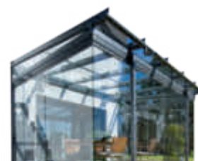
mit faltwänden aus Glas