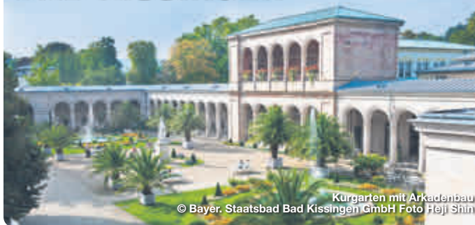
Kurgarten mit Arkadenbau

Im Herzen Deutschlands steht im Bayerischen Staatsbad Bad Kissingen der moderne Mensch mit seinem Bedürfnis nach Erholung und Entspannung im Mittelpunkt. „Zeit“ ist im bekanntesten Kurort Deutschlands zentrales Leitmotiv und überall zu spüren – in der eindrucksvollen Geschichte und Architektur, in den Gärten und Grünanlagen im Wechsel der Jahreszeiten, im ewigen Sprudeln der heilenden Quellen sowie den abwechslungsreichen Festen und Veranstaltungen. In Bad Kissingen verbindet sich altbewährte Bäderkultur mit Wellnessprogrammen auf höchstem Niveau, historische Ambiente trifft auf zeitgemäße Kultur- und Tourismusangebote.