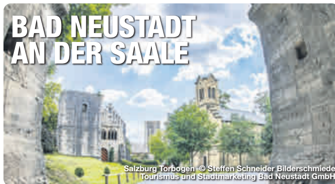
Salzburg Torbogen

Bad Neustadt a. d. Saale liegt in der Mitte Deutschlands, am Fuße der Bayerischen Rhön. Durch seine zentrale Lage ist der Ort gut zu erreichen und bietet viele Ausflugsmöglichkeiten in die vielseitige Region. Drei verschiedene, reizvolle Trails des DSV Nordic aktiv Walking Zentrums laden Walkingbegeisterte und Wanderer zum Entdecken ein. Die über 400 km markierten Wander- und Radwege auf teils stillgelegten Bahntrassen führen zu herrlichen Aussichtspunkten und beliebten Ausflugszielen in der Bayerischen Rhön. Das Wellness- und Erlebnisbad Triamare vereint Sport, Spaß und Wellness miteinander