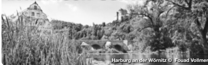
Harburg an der Wörnitz

Die Ausflugs- und Kurzurlaubsregion Bayerisch-Schwaben erstreckt sich vom Nördlinger Ries über das Schwäbische Donautal, die Fuggerstadt Augsburg und das LEGOLAND® bis ins Wittelsbacher Land. Radwege in idyllischen Flusslandschaften sowie Wander- und Themenwege durch die vielfältige Natur machen die Region zu einem beliebten Ziel für große und kleine Aktivurlauber. Zwischen prächtig-glanzvoll und verträumt-gemütlich präsentieren sich die Städte und Orte Bayerisch-Schwabens. Entlang der Romantischen Straße lassen sich viele Highlights verknüpfen. Kulturfans und Familien genießen das besondere Flair der historischen Stadtkulissen, Burgen und Straßenzüge, begeben sich auf die Spuren von Römern, Fuggern & Co.