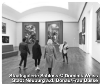
Staatsgalerie Schloss

TreffpunktDeutschland.de/neuburg-an-der-donau