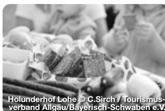
Hölenderhof Lohe

TreffpunktDeutschland.de/bayerisch-schwaben