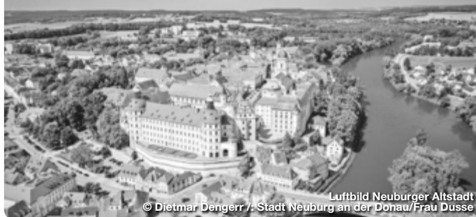
Luftbild Neuburger Altstadt

Höhepunkt des vollständig erhaltenen Altstadtensembles aus der Barock- und Renaissancezeit ist das weithin sichtbare Residenzschloss, das den ältesten evangelisch-lutherischen Sakralbau der Welt beherbergt und in der Staatsgalerie Flämische Barockmalerei wertvollste Exponate von europäischem Rang eindrucksvoll präsentiert. Neuburg an der Donau hat aber auch Aktivurlaubern viel zu bieten. Die Stadt liegt direkt am Donauradweg. Die attraktive Lage im Donautal an der Grenze zwischen Fränkischer Alb im Norden sowie Donaumoos und Hügelland im Süden macht Neuburg an der Donau auch zum idealen Ausgangspunkt für Wanderungen durch reizvolle Landschaften.!