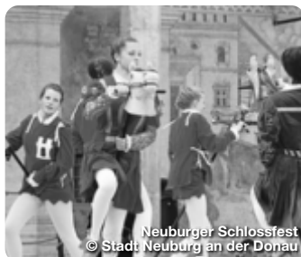
Neuburger Schlossfest