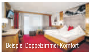
Beispiel Doppelzimmer Komfort