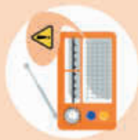
Radio & TV

Diese Informationen sollen so viele Menschen wie möglich erreichen. Deshalb gibt es verschiedene Wege, sie zu verbreiten: