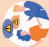
Familien- und Freundeskreis, Nachbarschaft